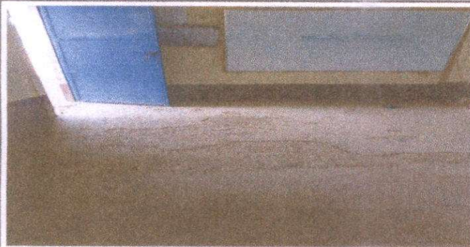
Foto 3 . Estado actual del piso del aula